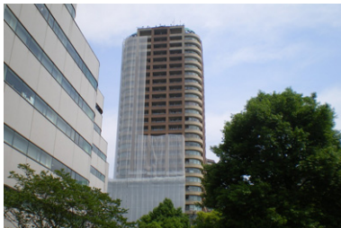
アス西早稲田第1回大規模修繕工事