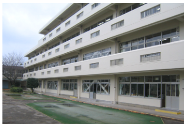
我孫子市新木小学校