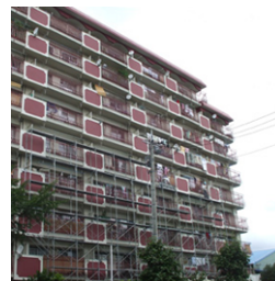
美女木ハイツ建物