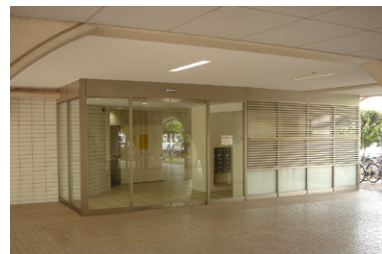
西新小岩リバーハイツエントランス改修工事