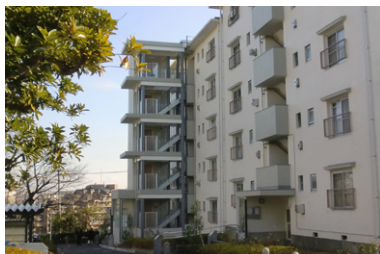
高幡台団地42号棟エレベータ設置その他工事