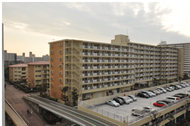
潮路北第一ハイツ住宅大規模修繕工事