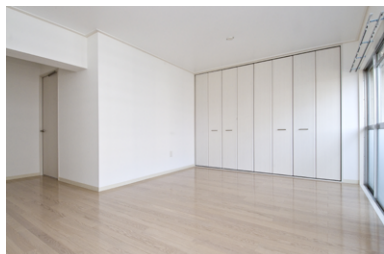
美浜西エースタート新リノベーション設計