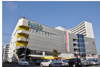
アリエビル大規模修繕その他工事